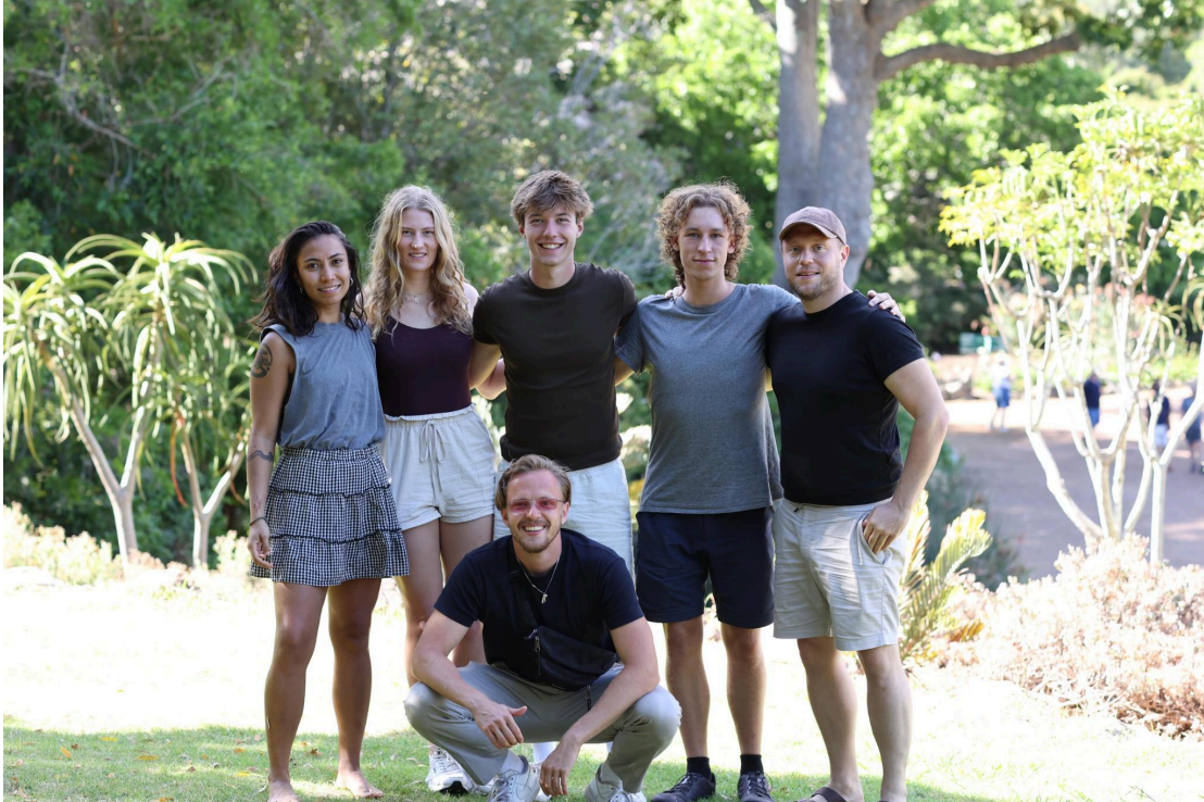
Kapstadt, Südafrika 2025 Freiwilliges Nachmittagscoaching mit jungen Menschen, die ihre ersten Schritte als Unternehmer/innen gehen.